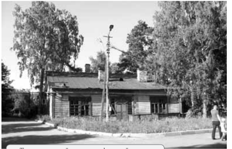
Так выглядит сейчас один из флигелей...

Лиричное и грустное письмо об отношении к нашей местной природе пришло в редакцию.