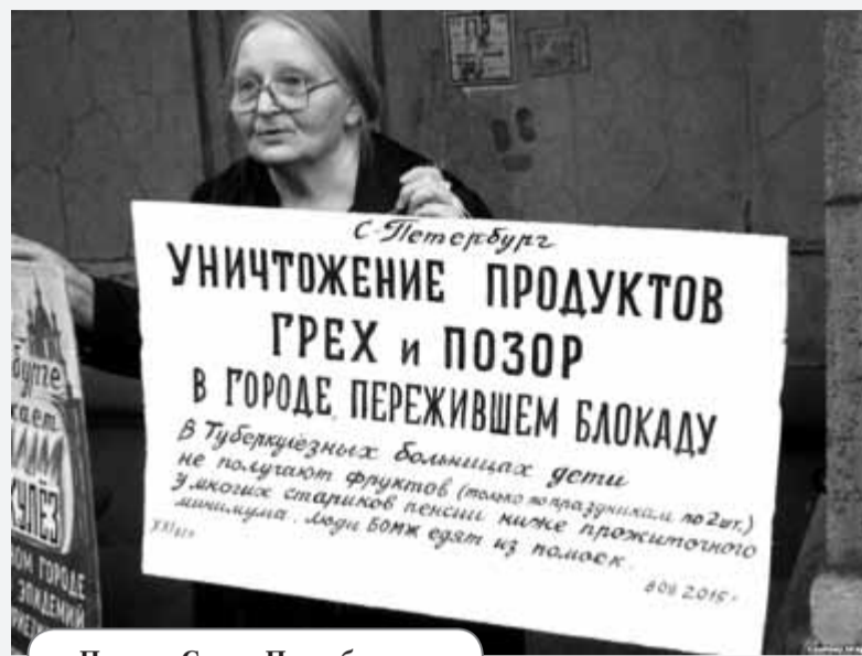
Пикет в Санкт-Петербурге

Во-вторых, в Европе вместо простого сжигания и закапывания на полигонах используется компостирование, метановое или анаэробное брожение, а также сжигание в специальных инсинераторах, позволяющих выделять выделяемую при горении