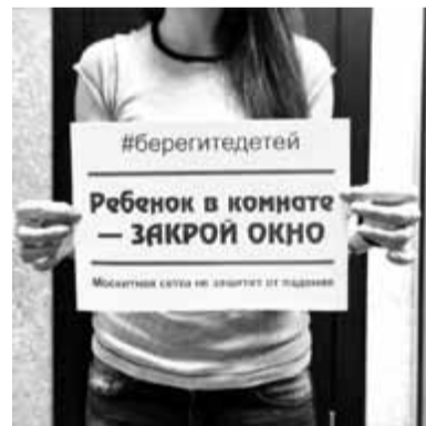
Фото: Волгоградские журналисты запустили в социальных сетях флешмоб «Ребенок в комнате – закрой окно», к акции присоединились многие регионы.

Но главное – помнить самим и объяснять детям грозящие им опасности.